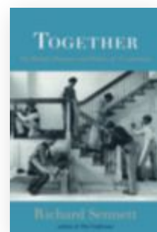
RICHARD SENNETT Together: The Rituals, Pleasures and Politics of Cooperation Penguin, 2012